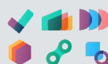
Aplicaciones de operaciones

COMO PARTNERS CERTIFICADOS DE ODOO, TE AYUDAMOS A ADAPTAR LAS APLICACIONES NATIVAS A LAS PARTICULARIDADES DE TU ORGANIZACIÓN