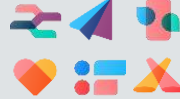
Aplicaciones de marketing